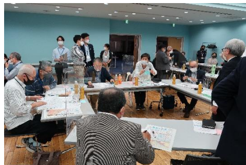
ワークショップでは、各地区の水害リスクを踏まえ、避難の課題とその解決方法について地区ごとに意見を出し合いました