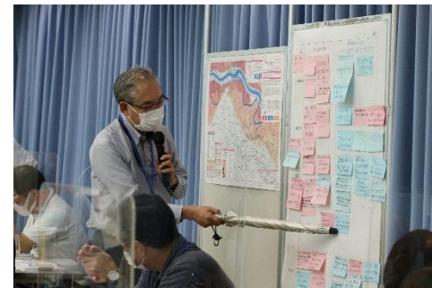
話し合いの最後に、話し合った結果を代表者が発表し、全体で共有しました