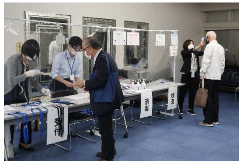
受付にも飛沫防止パーテーションを設置し、参加者全員の検温と手指消毒を行いました