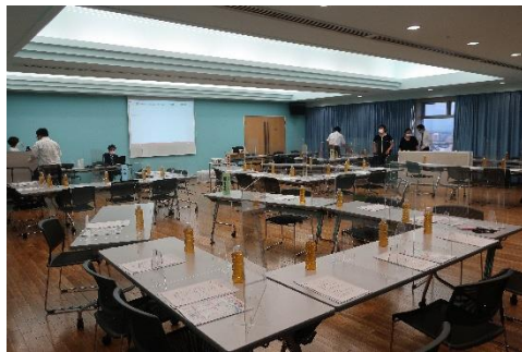
感染症対策のため、会場の座席は間隔を開けたうえで卓上パーテーションを設置しました