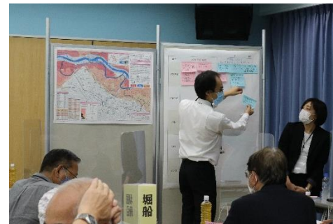
付箋に意見を書き出し、課題ごとに分類していきました