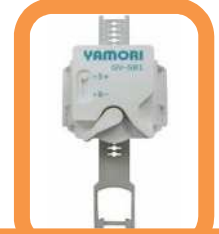
簡易型感震ブレーカー