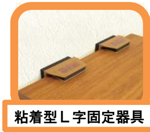
粘着型L字固定器具