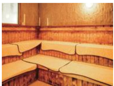
増築された常連お墨付きのサウナ。