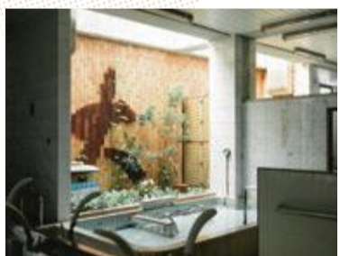
室内でも自然を感じられる木々と天窓からさしこむ陽光。