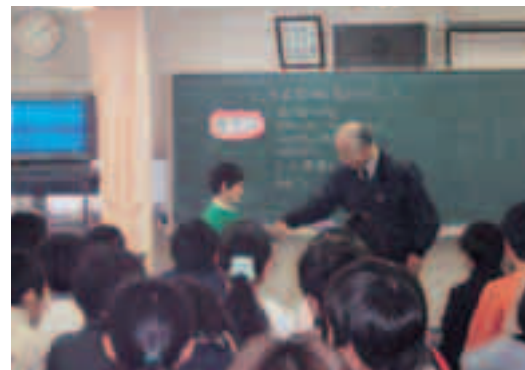
滝野川第三小学校