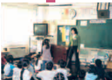
滝野川第二小学校 PTA主催