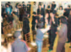
としま若葉小学校