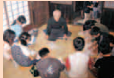
4年生 社会「くらしのうつりかわり」古民家で昔の食事について学ぶ