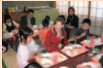
2年生 和室に外国のお客様をお招きして楽しい給食時間