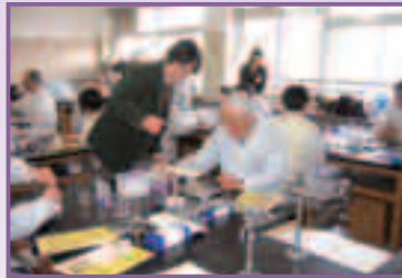
大人の理科実験講座

今後も、委員会では実際に活動を担ってくださる方を募集していきます。ぜひ、みなさんも一緒に活動してみませんか。