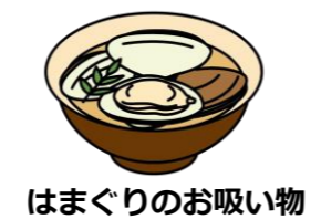
はまぐりのお吸い物

3月3日は「ひな祭り」。女の子の健やかな成長を願ってお祝いをする日本の伝統行事です。現在のように、ひな人形を飾ようになったのは江戸時代のことで、もとは人形を身代わりにして邪気をはらう「流しびな」が起源とされます。行事食として、ちらしずし、はまぐりのお吸い物、ひしもち、ひなあられなど、華やかな食べ物が並びます。