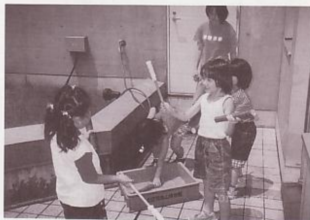
「私の水鉄砲もできたよ！」すっかりみんな仲よし

また、子どもたちにも、博物館は楽しいところだと認識してもらうことがねらいです。ほとんどの子どもは学校の授業の中ではじめて博物館を訪れるのではないのでしょうか。そして、博物館は勉強する場所だというイメージを持つでしょう。確かに博物館はモノを調べたりする場所ではあります。そして、知識を得るよろこびを与えてあげるのも博物館の一使命でもあります。しかし、そればかりではありません。今回、「GOGO博物館」として昔の遊びを行いました。昔の遊びを知識として知ると共に、実際にやってみることがとても重要なことです。初めてその日に会った、年令も違う子どもたちでしたが、すぐにいっしょになって遊んでいました。しかも、年上の子は年下の子をかばったりしている風景も目にしました。子どもは昔も今も変わらないものです。ただ、みんなで体を使って外で遊ぶ場、あるいはそのようなシチュエーションが極端に減ってしまったというだけなのです。これから、学校は完全週休2日制になります。博物館は学校とは違った子どもたちのコミュニティーを作れる場と成り得ます。あるいは、そうするべきなのかもしれません。今年の夏は、何かこれから博物館ができること、するべきことを垣間見たような気がします。子どもたちがもっと博物館が楽しく、身近に感じてもらえるために、そして、子どもたちが次代の博物館の支援者となるためにも、今回のような企画はこれからも必要であると思います。