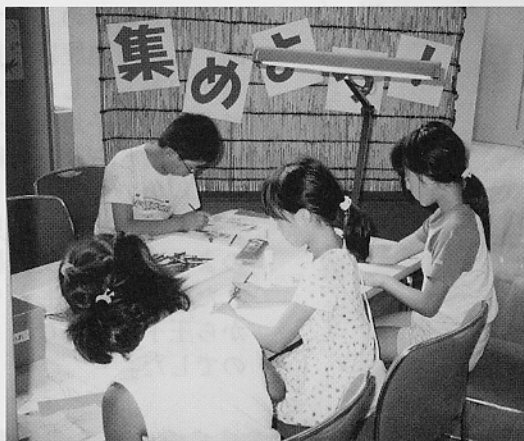
コラージュに熱中する子どもたち