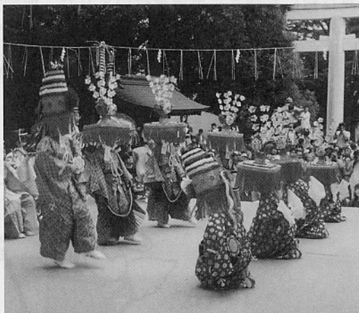
雅でファンタスティックな躍です

さて表題、別に中世スコラ哲学のように「普遍の王子田楽」の実在性を否定して、真に存在するのは毎年「個々の王子田楽」だけである、といった唯名論的議論をするわけじゃないのデス。そもそも中世にはこの田楽が何と呼ばれていたのかという問題、裏を返すと「王子田楽」という言葉はいつ頃から出現したのかという