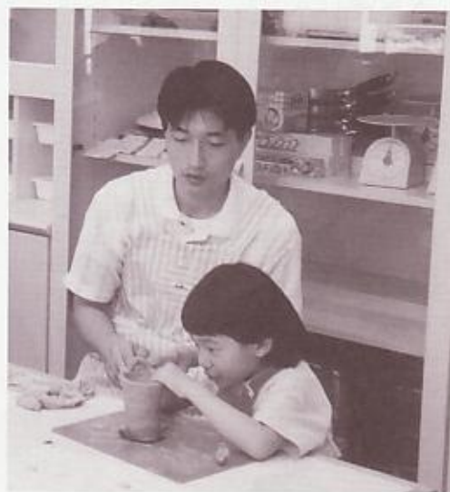
親子で縄文土器作り

北区飛鳥山博物館では多種多様な来館者のニーズに応えるため、様々な事業を展開しています。中でも、今年度力を入れているのが子ども向けの各種事業です。開館以来、夏には「夏休み土器作り教室」や「博物館クイズラリー」など子どもを意識した事業を展開してきました。しかし、今年度はさらなるステップアップとして、夏休みを「夏休みわくわくミュージアム」と名づけたイベント期間として事業を展開しました。そこで、従来行っていた事業に加え、「季節の草木染め」や「昔の道具を作ってみよう」など新規事業を行いました。また、5のつく日は「GOGO博物館」として昔の遊びを行いました。期間中の事業の延べ日数は、21日になります。期間中の館の開館日が36日ですから、その約2/3、つまり2日に1回以上の割合で何らかの事業が行われたことになります。また、これらの事業とは別に閲覧コーナーでは「絵本の小部屋」が、特別展示室では「思い出空間 夏を集めよう！」が期間中の全日において開かれました。前者は自由に絵本を読める空間で、そこを使って事業も行われました。後者は昭和40年代の夏をテーマにした、親にして