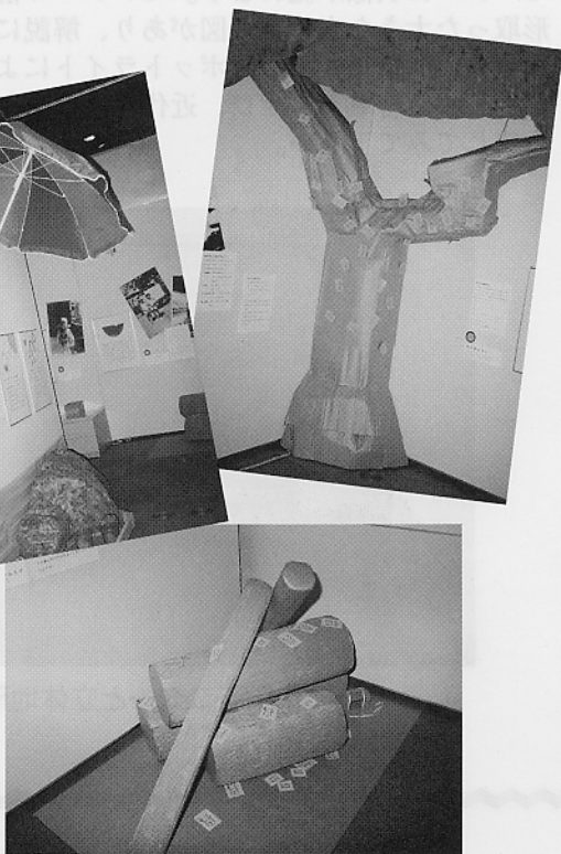
木、海岸の岩、丸太も全てダンボールを使った手作り

親子は北区内のマンションに暮らしている4人家族。父親(42才)は関東近県出身でサラリーマン、母親(38才)は北区生まれの専業主婦。子どもは9才(小学校3年生)の女の子と6才の弟の2人兄弟、という設定です。この設定をもとに、親が自分の子どもと同じ小学3年生だった頃の夏をテーマにしようと考えました。つまり昭和40年代の夏です。