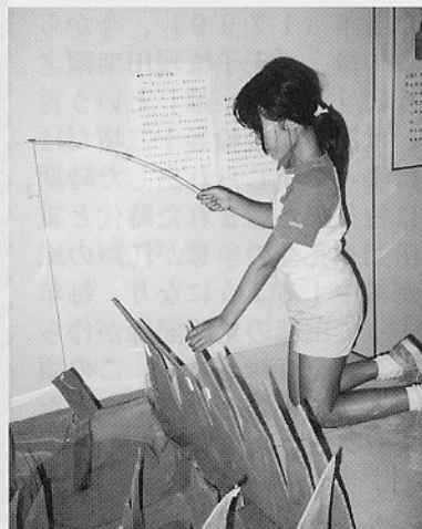
ダンボールの池でザリガニ三つり！

今年の夏は他にも様々な事業を行いました。博物館での体験が今年の夏の思い出として、1人でも多くの子ども達の心に何かしら残ってくれたら、と願っています。(久保埜企美子)