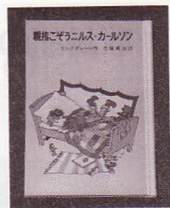
珠玉の短編作品集

夏休み期間中、閲覧コーナーで開催した「絵本の小部屋」では、「こんな子ども部屋があったら」「通年で開催して欲しい」などの声が聞かれお客様にも好評でした。今後も更に閲覧コーナーを活用して頂ける様々な企画を考えて参りたいと思います。(岩崎みどり)