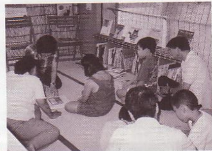
「絵本の小部屋」での事業風景