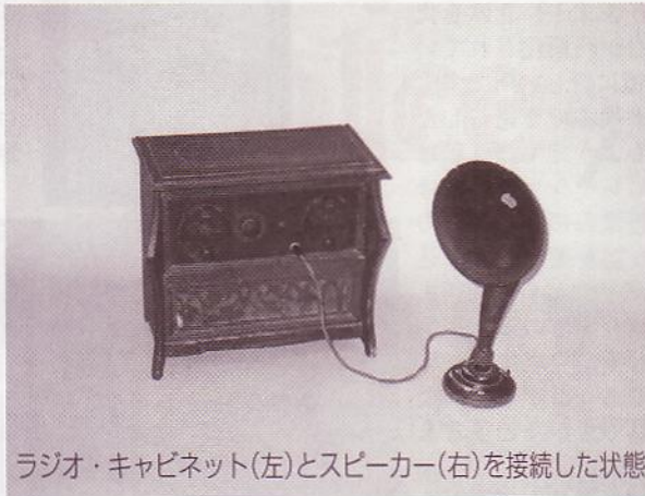
ラジオ・キャビネット(左)とスピーカー(右)を接続した状態