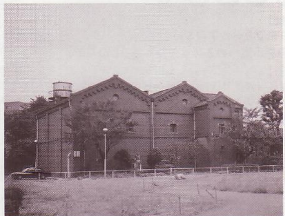
旧醸造試験所工場棟(現・酒類総合研究所) 滝野川2-6-30