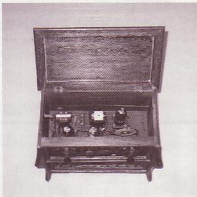
キャビネット内部のようす

左の写真を見て、コレが何かすぐにわかりますか？蓄音機？もしかしてラップ型のは大きなマイク？いえいえ、違います。コレは私たちの生活に馴染み深いある電化製品なのですが…。実はコレ「ラジオ」なのです。