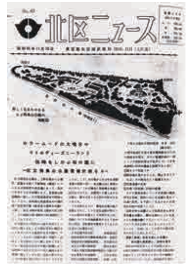
北区役所広報課発行「北区ニュース」 昭和40年11月10日号 (北区役所広報課所蔵)