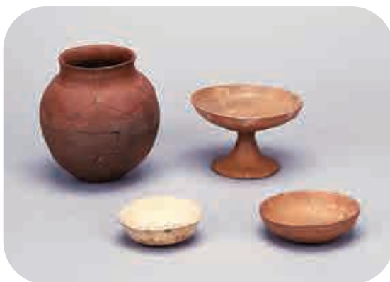
御殿前遺跡 特殊遺構出土土器

上記のような遺構の状況および土器の特徴から、この「特殊遺構」は豊島郡衙創設期に地鎮祭を執り行なった遺構であると考えられています。現代でも行なわれている地鎮の儀が古代においてすでに実施されていたことを、遺跡を通してこれらの土器は伝えてくれます。（高坂）