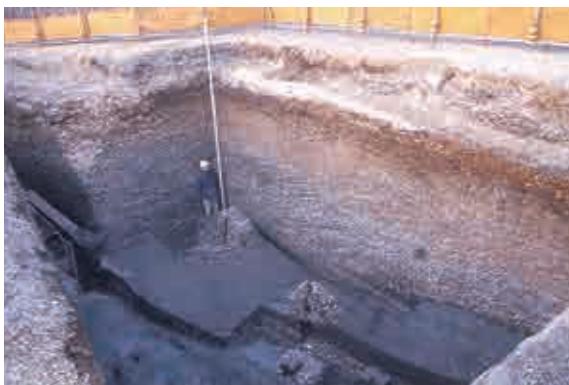
最大で4.5mもの厚さになる貝層（中里貝塚）