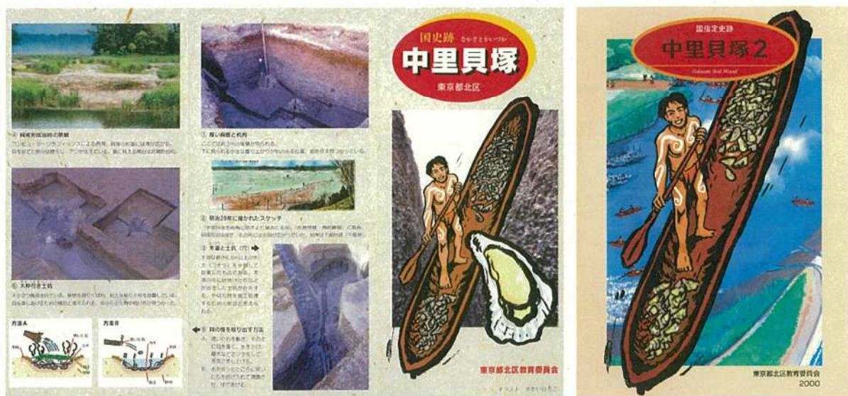
第28図 史跡のパフレットなど