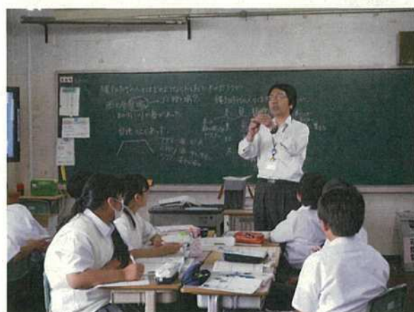
写真28 出張授業（中学校）