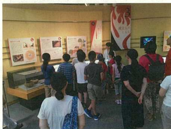
写真29 博物館見学（団体受け入れ）