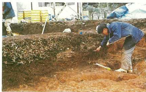
写真24 七社神社裏貝塚