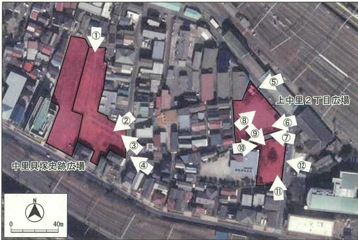
第 26 図 その他の諸要素：写真位置図