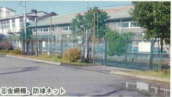
⑧金網柵、防球ネット