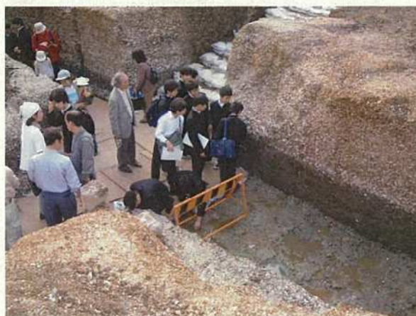
写真32 発掘現場の現地見学会（中学生）