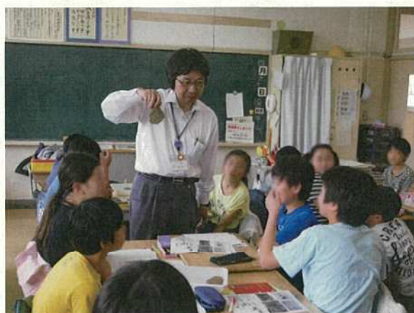
写真27 出張授業（小学校）