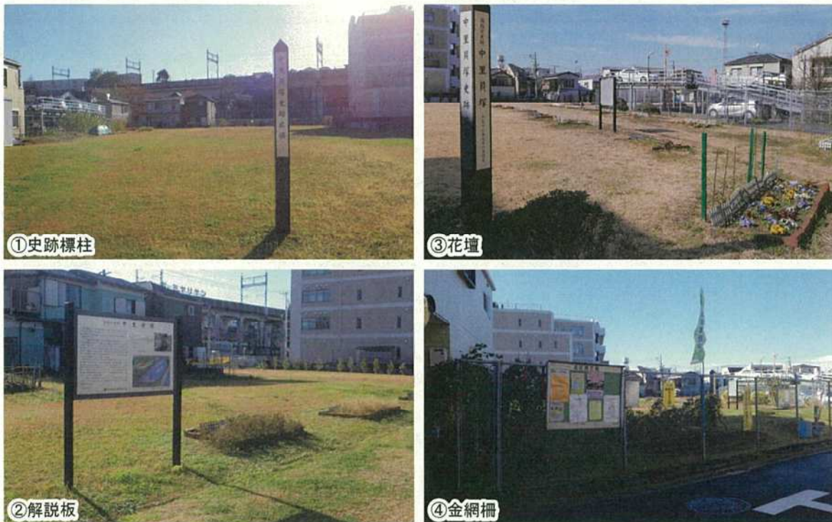
写真 22 その他の諸要素（中里貝塚史跡広場）