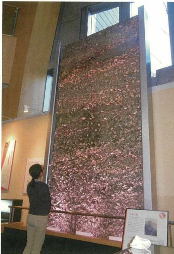
写真 33 博物館の常設展示（剥ぎ取り標本）