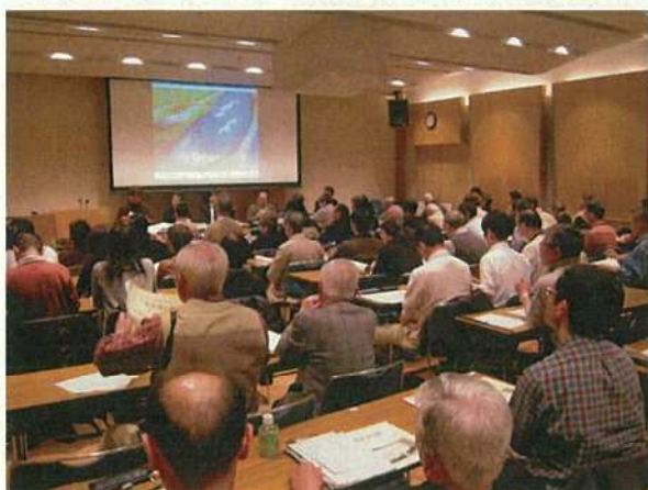
写真31 企画展記念シンポジウムの様子