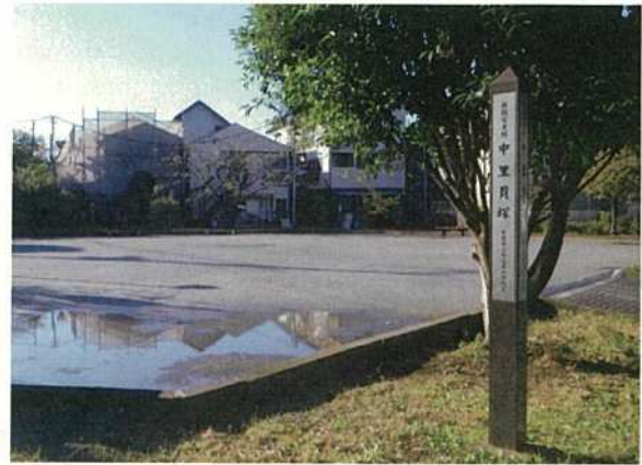
写真 34 上中里 2 丁目広場（A 地点）