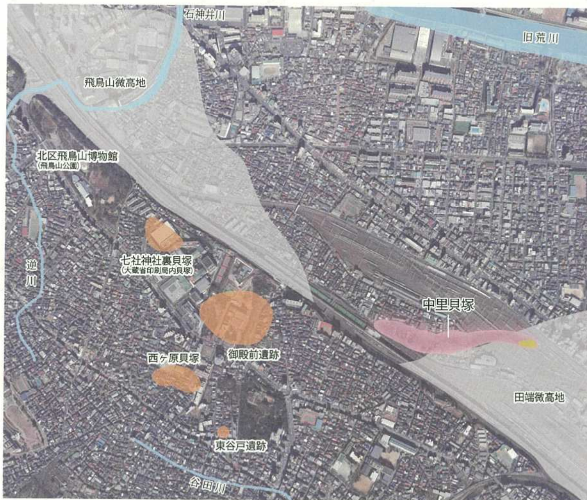
第27図 指定地の周辺地域を構成する諸要素

現在の2箇所の史跡指定地は、東西方向に長さ700m、幅100m以上の範囲に広がる中里貝塚の一部が指定されている状況となっており、その貝層は史跡指定地の外にも続いている。また、指定地の周辺には、中里貝塚が形成された当時の地形を示す微高地や、中里貝塚に関する遺跡等が分布しており、当時の姿を理解する上で重要な要素となっている。