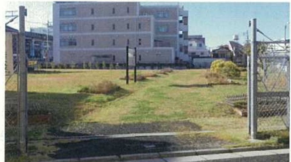
写真 35 史跡広場（B・J 地点）