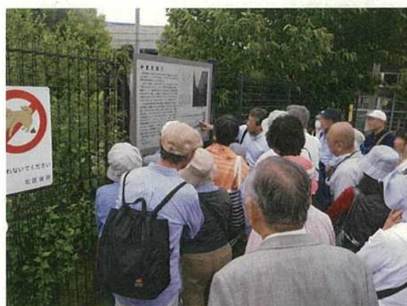
写真26 北区遺跡学講座「中里貝塚」