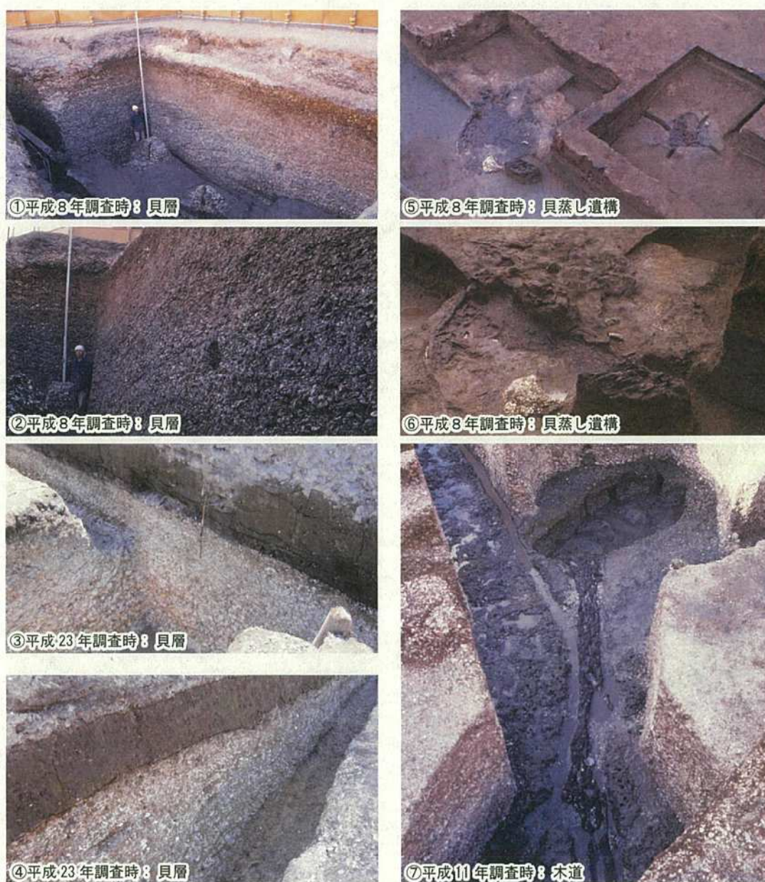
写真 21 本質的価値を構成する要素

中里貝塚の本質的価値を構成する要素としては、第一に最大厚 4.5m の貝層が挙げられる（写真 21：①～④）。また、貝蒸し遺構の木枠付土坑（写真 21：⑤、⑥）、木道（写真 21：⑦）、土坑、焚き火跡、貝層に打ち込まれた杭などの遺構に加え、作業空間としての砂堆や波食台といった地形的な要素も含まれる。さらに、地下に埋蔵されているその他の遺構や遺物、北区飛鳥山博物館に展示・収蔵されている貝層の剥ぎ取り標本や出土遺物なども本質的価値を構成する要素といえる。