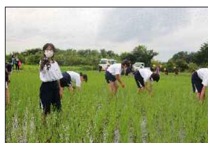
サブファミリー農業体験