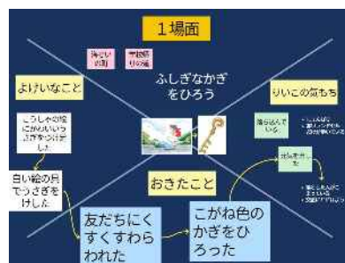
ロイロノートの活用の様子

第1回の協議会では自己紹介から始め、教員間の人間関係を確立し、その後の協議が円滑に進むようにした。各分科会では、ICTの活用方法を中心に協議を進め、各教科等で活用しているアプリについて理解を深めることができた。さらに、ICTの活用をすべき場面と不向きな場面について意見交換が行われた。