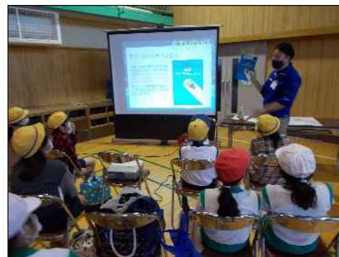
サブファミリー防災・減災教育