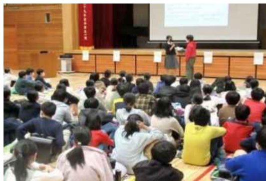
新入生体験入学（飛鳥中）