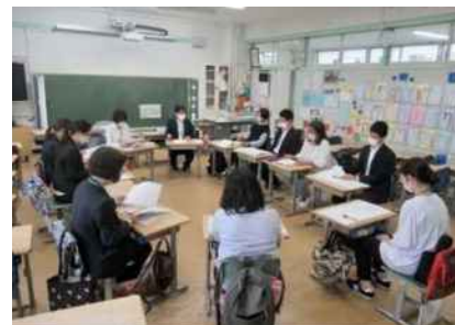
S F 分科会打合せ（滝野川小）