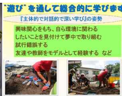
幼稚園の教育の様子