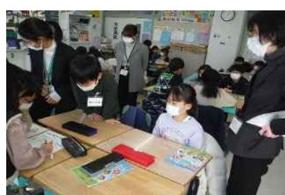
中学校の教員が小学校の授業に入り T T 授業を実施 (西ヶ原小)