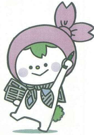
北区新聞大好きプロジェクト マスコットキャラクター