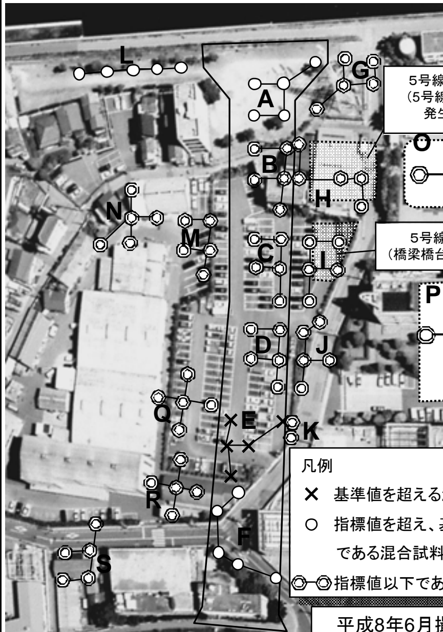
(1)都市機構調査結果