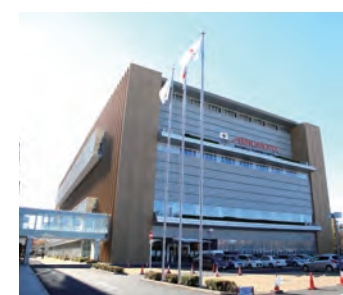
味の素ナショナルトレーニングセンター・ウエスト

世界を舞台に戦うアスリートの練習、スポーツ医・科学の研究と支援の拠点が「ハイパフォーマンススポーツセンター (HPSC)」です。HPSCは「国立スポーツ科学センター (JISS)」及び「味の素ナショナルトレーニングセンター (NTC)」で構成されています。そのほか、サッカー専用競技場（味の素フィールド西が丘）や一般利用可能なフットサルコートと屋外テニスコートがあります。令和元年9月には、新たな拠点「味の素ナショナルトレーニングセンター・イースト」が開所しました。