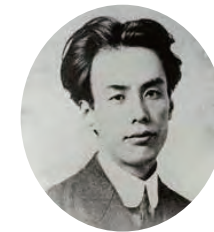
小説家 芥川龍之介 Novelist: Akutagawa Ryunosuke