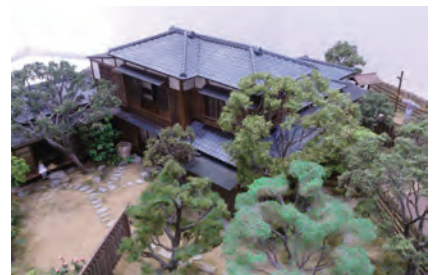
芥川龍之介 田端の家復元模型

After opening the Tokyo School of Fine Arts (present name: Tokyo University of the Arts) in Ueno, 1889, young artists started to move to Tabata to be near Ueno. For example, in 1900 Kosugi Hoan [Painter], in 1903 Itaya Hazan [Ceramicist] and so on, moved in. Akutagawa Ryunosuke [Novelist] moved to Tabata in 1914 and Muro Saisei [Poet, Novelist] moved to there in 1916 to be followed by many novelists and poets. The trajectory of these artists and writers can be seen from the works and materials that are exhibited in Tabata Memorial Museum of Writers and Artists.