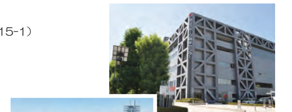
国立スポーツ科学センター