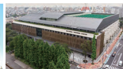
味の素ナショナルトレーニングセンター・イースト