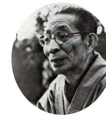
詩人・小説家 室生犀星 Poet and Novelist: Muro Saisei