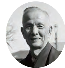
陶芸家 板谷波山 Ceramicist: Itaya Hazan