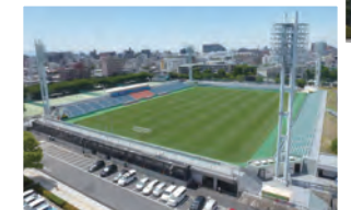
味の素フィールド西が丘