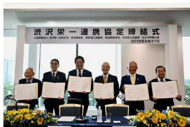
関係団体との協定