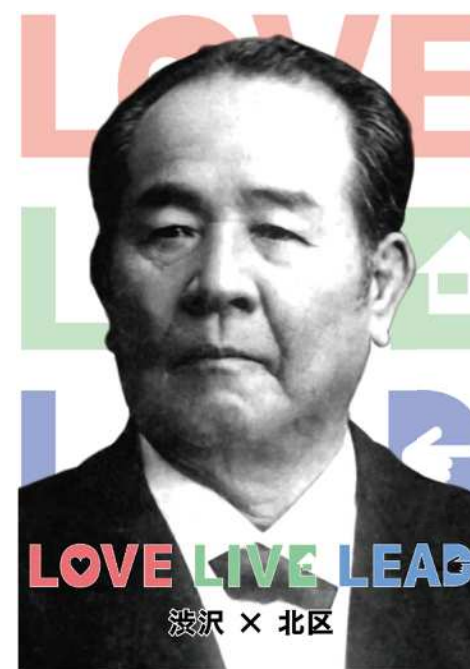
プロジェクトポスター