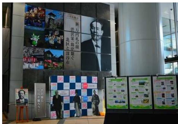
埼玉県深谷市との展示会 令和2年11月17日（火）