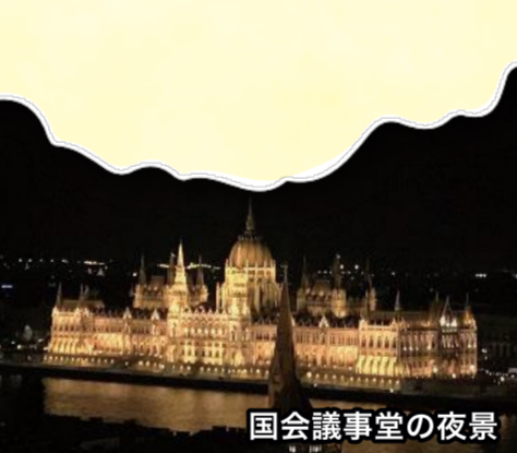
国会議事堂の夜景