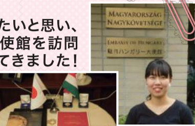
駐日ハンガリー大使館