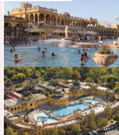
ヨーロッパ最大の複合温泉施設 セーチェーニ温泉