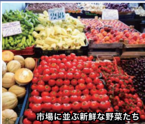
市場に並ぶ新鮮な野菜たち

■サーブル [サーブルの有効面は上半身のみ] ハンガリー騎兵隊の剣技から競技化した種目。剣身のどの部分での攻撃も有効。突きの他、斬り技もOK。有効面に触れただけでポイントになりますが、フルーレと同様に「優先権」があるため、選手の駆け引きが楽しめます。