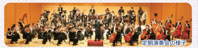
定期演奏会の様子

日程: 2020年5月17日(日) 午後2時開演 場所: 北とぴあさくらホール ※詳細は、2020年2月頃に北区文化振興財団HPをご覧ください。