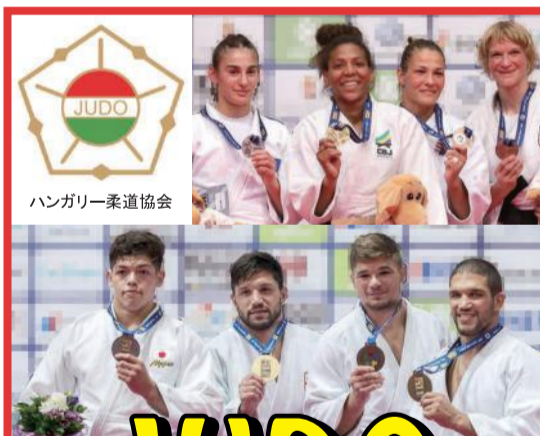
ハンガリー柔道協会