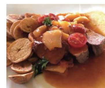
ハンガリーで生まれた様々なパプリカを用いた美味しい料理

ドナウ川河岸に広がり、壮麗な建物が建つ街並みの美しさから「ドナウの真珠」とも称される街、ブダペスト。アジアの騎馬遊牧民族・マジャル人によって9世紀末に築かれたのが起源で、16世紀にはオスマン・トルコ、18世紀からはオーストリアに支配された。1867年に自治権を与えられたことを契機に、都市景観の整備が進み、壮麗な国会議事堂やオペラハウスなど、今日のブダペストの主要な景観を成す建築物はこの時期に造営されている。ドナウ川にかかるくさり橋や、ブダ王宮、国会議事堂一帯の建築群は特に美しく、街は1987年に世界遺産にも登録された。リストやバルトークといった有名な作曲家が生活した街でもあり、オペラやクラシックのコンサートが数多く開かれるほか、民俗音楽やハンガリー舞踏などのフォークロアショーも盛んに行われている。