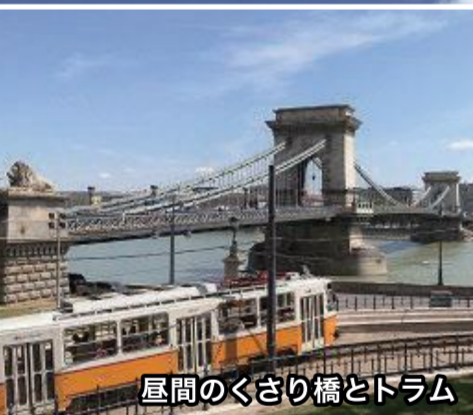
風間のくさり橋とドラム