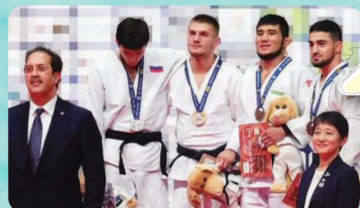
男子73kg級の表彰式でプレゼンターを務めた依田副区長(右側一人目)