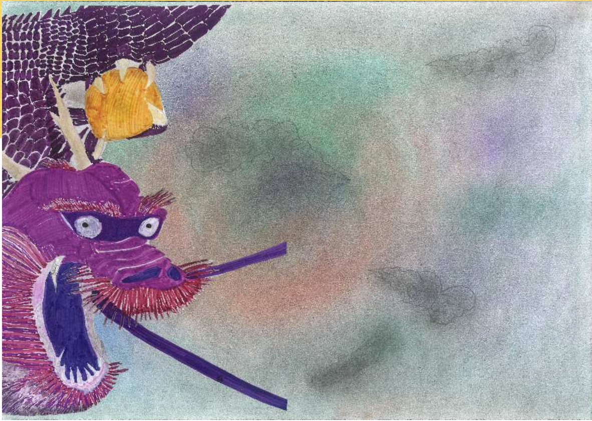
宮坂 賢次「辰」 (就労継続支援B型事業所 あいアイ工房)