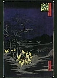
名所江戸百景 王子装束履の 木大晦日の狐火割川伝直画 北区飛鳥山博物館所蔵

問い合わせ先：王子狐の行列の会 Tel. 3911-5008(マツヤ) Tel. 3911-2227(菊秀)