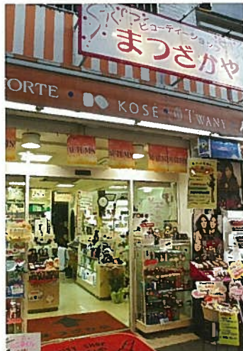
板橋駅から徒歩5分。6年前改装した店内は明るく清潔感がある。

まも多いのだとか。「『すべてのお客様をより美しくする』が店の方針。安さではない『利』をお客さまに感じてもらうようつとめています」。店内でエステを始めたのも、そうした思いから。「エステティックサロンのゴージャスさはないけれど、利用する商品の質やスタッフの技術は確かなもの。自信を持っておすすめできます」。