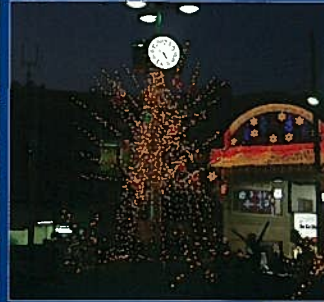
JR十条駅北口駅前、十条銀座商店街振興組合