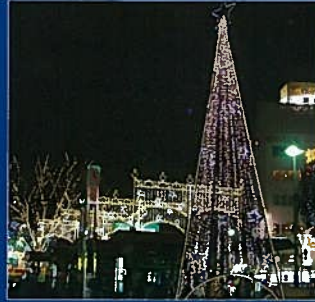
JR赤羽駅東口駅前、赤羽商店街連合会

区内のJR駅前を近隣の商店街が、イルミネーション装飾しています。冬空の下、幻想的な光の芸術を楽しんでみてはいかがでしょうか。