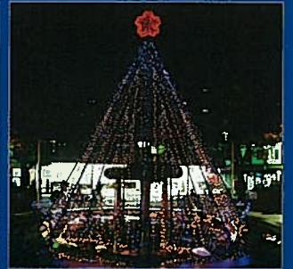
JR板橋駅東口駅前、滝野川さくら通り商栄会