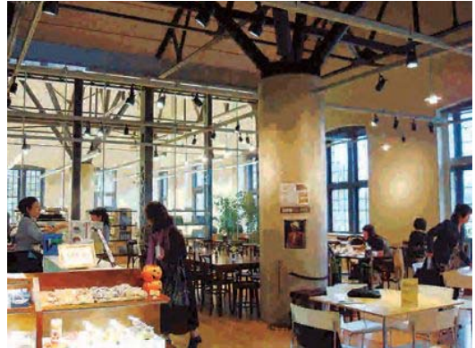
▲高い天井で開放感のある店内