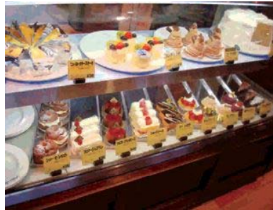
▲12種類のケーキが用意されています

おしゃれな空間で名店の美味しいケーキとお茶でゆったりした後、図書館に寄って好きな本を読んだり、借りたりするなんてスマートじゃないですか？