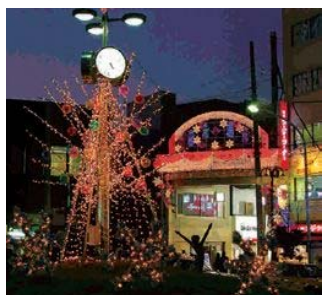
▲JR十条駅北口駅前 十条銀座商店街振興組合