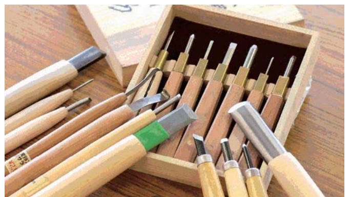
彫刻刀は500種類ほどもあり、刃の大きさも様々なため、オートメーション化は難しい。1本1本に職人の技が生きている。

「彫刻刀は膨大な種類があるうえ、すべて職人による手作り。採算的にも大手メーカーには難しい。うちのよう小さな会社だからこそやっていると強みがあるんです。ネット販売なども取り入れて、もの