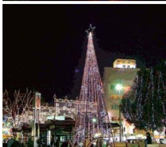
▲JR赤羽駅東口駅前 赤羽一番街商店街振興組合