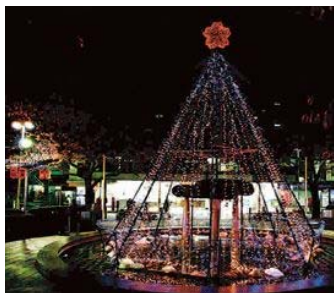
JR板橋駅東口駅前 海野川さくら通り商栄会▶

今年は区内6カ所、5つの駅がイルミネーションで彩られます。それぞれの場所で異なったテーマのイルミネーションを楽しむことができます。寒い冬の夜を彩るイルミネーション、あなたは誰と見に行きますか？