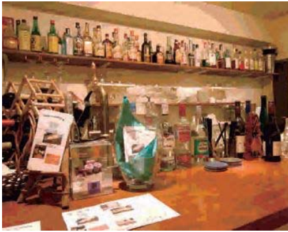
白を基調とした明るい雰囲気店内。

憧れの人と同じ土俵に 道行く人がふと足を止めるガラス張りのしやれたお店。そこが昨年10月にオープンしたカフェイタリアン料理の店「& Jeu(アンジュ)」です。