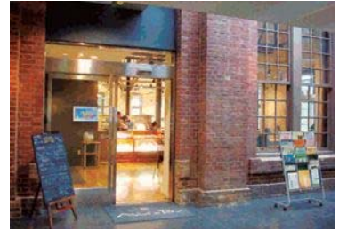
▲アトリエ・ド・リーブ入口