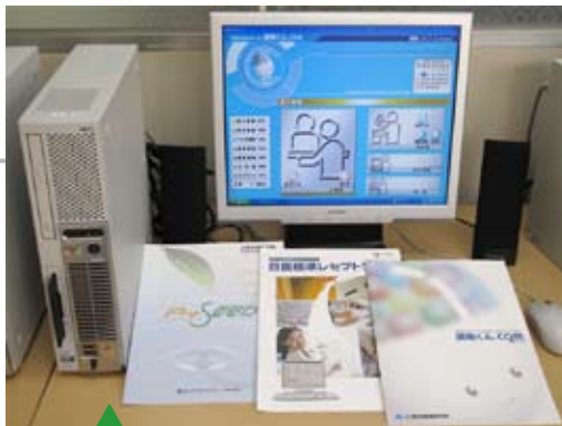
医療事業部で扱っている医療業務用ソフト「調剤くん」とシステムの一例。

会社西野製作所医療事業部レセコンソムリエ 専務取締役とある。医療機関向けレセプトコンピュータ（診療報酬請求システム）のソムリエの意味である。安心を求めるお客様のニーズにお応えするため、彼は今後少数精鋭で行くという。質の高いサービスを武器にした地に足のついた経営で、着実に成長するのが当面の目標である。きっとそれは社員と家族の幸せにつながっている。