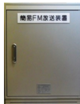
FM ラジオ再放送装置 高速道路トンネルなど