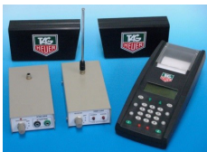
スポーツタイム計測装置

“こんなモノ出来ないか” に52年培った高度な技術と幅広い経験に先端技術を加えてお応えする、開発・研究型メーカーです。