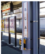
JR 向け無線式列車発車ベル装置

平成20年に打ち上げられた人工衛星「かがやき」に当社の無線通信システムが搭載されました。