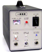
電車用非常電源装置

スキー、陸上競技、自動車レースなどあらゆるスポーツ競技の世界標準計時装置として活躍しています。