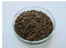
堆肥化用 排便処理用の微生物製剤