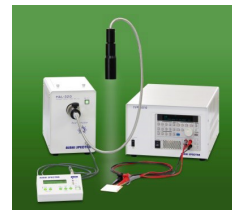
光学機器 (太陽電池評価システム)