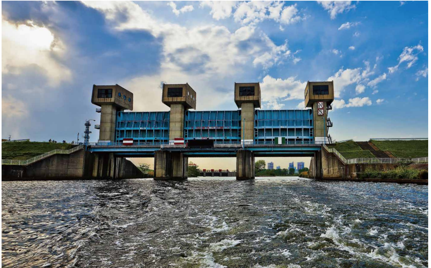
第2回 北区観光写真コンクール 観光部門「岩淵水門の夕暮れ」