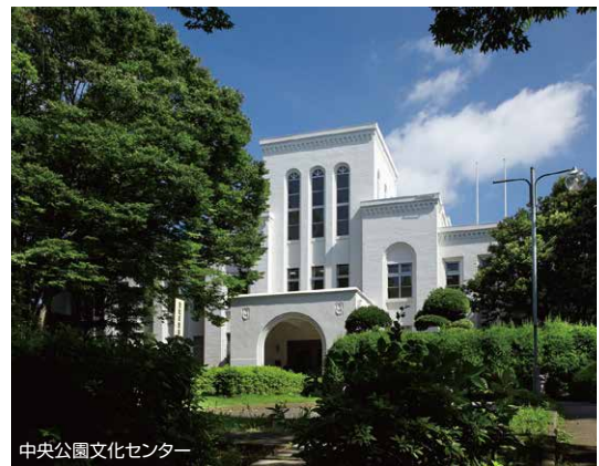
中央公園文化センター

現在、景観形成方針地区として、軍用地跡地に整備された中央公園、既存の赤レンガ倉庫を活かした中央図書館など、地区内の景観資源との調和に配慮した景観づくりを目指していますが、今後は、景観形成重点地区への指定も視野に、特性に応じた景観づくりを進めていきます。