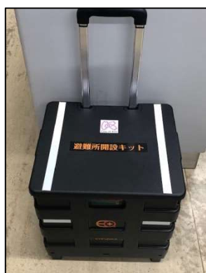
避難所開設キット

来年度は、本キットを活用した避難所開設訓練の実施を、自主防災組織に積極的に呼びかけて参ります。