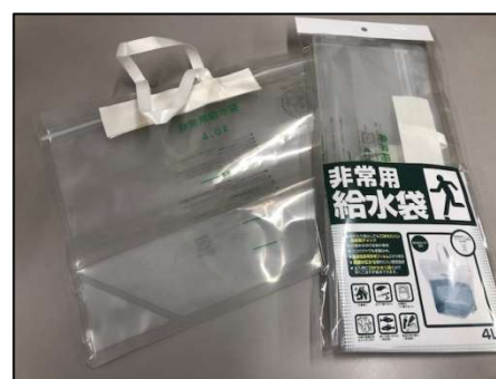
手提げ式給水袋（標準水位4ℓ）