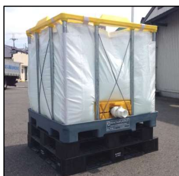
給水タンク組み立て時

また、在宅避難者も含めて給水タンクの水を配布できるよう、手提げ式の給水袋を各避難所に200枚ずつ備蓄して参ります。