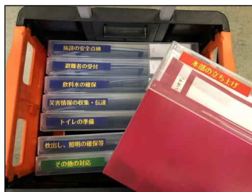
内容物のイメージ