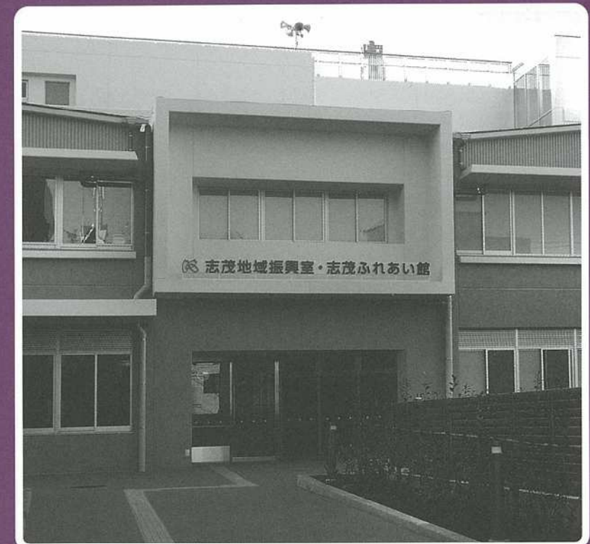
北区立なでしこ小学校 校舎内 1階