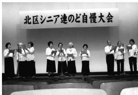
美声コーラス隊の皆さん

最後に、家族の命が奪われる苦しみには言葉にならず、私と同じ思いは誰にもさせたくありません。 どうか「戦争のない日本」であって欲しいと、切に願っております。