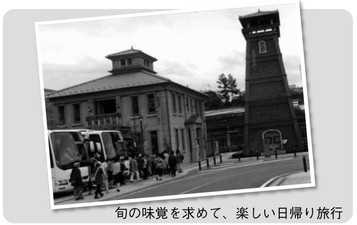
旬の味覚を求めて、楽しい日帰り旅行

8月27日(木)滝野川支部と滝野川警察署による、輪投げ大会が、滝野川会館大ホールで行われ、支部から36チーム、警察署から1チームの37チームが参加しました。このチームの中から、10月に行われる北シニア連の輪投げ大会に20チームが出場することになります。