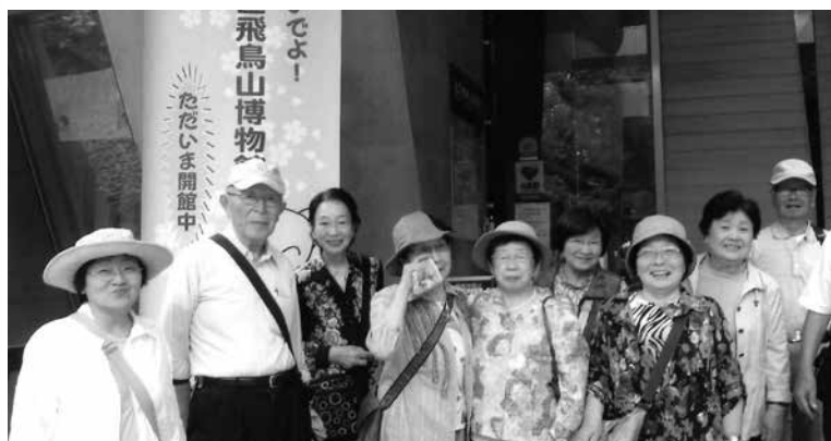
飛鳥山博物館の前にて

今度は秋、年末に向かい、また多忙なスケジュールですが、皆元気で健康的な日々を過ごしてまいりたいと思っております。