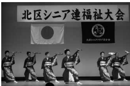
東京都芸能大会準優勝、桐ヶ丘みのり会の踊り