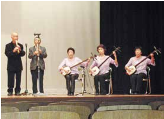
歌と演奏で観客を魅了

日本の伝統的な芸能に取り組み22クラブが66曲を披露。それぞれの十八番を声高らかに歌いあげました。