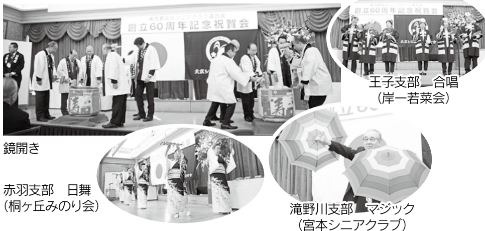
王子支部 合唱 (岸一若菜会)

鏡開きを行い、記念すべきこの年を祝福しました。演芸では宮元シニアクラブがマジック、桐ヶ丘みのり会が日舞、岸一若菜会が合唱を披露し、三者三様の技で会場を盛り上げました。