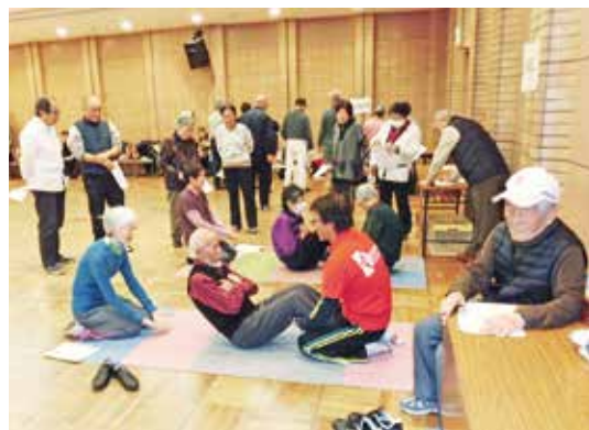
積み重ねが結果になります

日々の積み重ねが測定の結果となります。「継続は力」を肝に銘じ、参加者は今後の生活に結果をいかしてください。また、自身の体の状態を知るのには、健康への第一歩です。今回参加しなかった方の積極的な参加をお待ちしております。