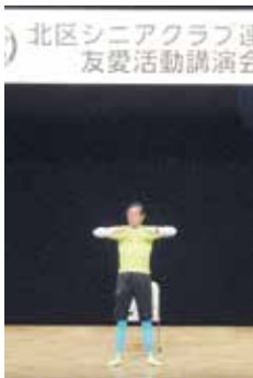
身体を動かして健康に