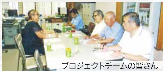
プロジェクトチームの皆さん