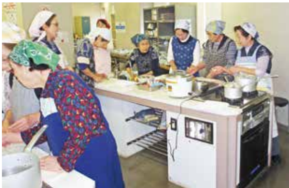
おいしそうなメニューに挑戦

11月7日(水)～9日(金)の3日間、赤羽文化センターで料理教室が行われました。今回のテーマは「元氣シニアになるための食事のヒント」です。