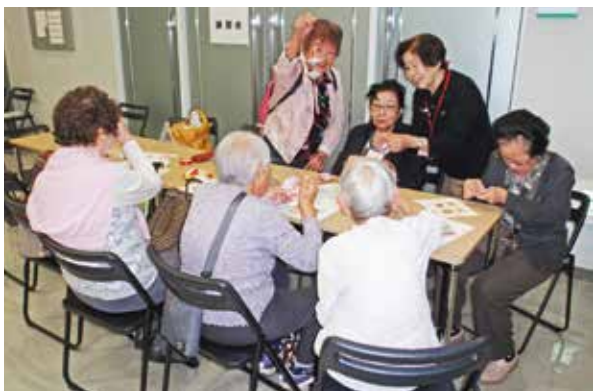
手芸をとおして交流

10月20日(土)・21日(日)に行われたシニア作品展の受付後ろでは、手作り品講習会も実施されました。参加者は60名。会員が『つるし飾り』の講師となり、地域の皆さんと交流するよい機会となりました。