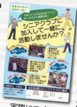
実際につくったチラシ