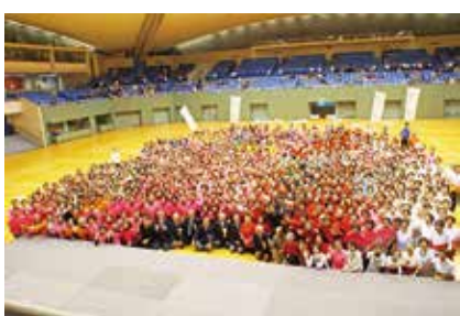
約1500名が集い交流しました

11月21日(水)、駒沢オリンピック公園総合運動場体育館にて、シニア健康フェスタ東京が行われました。