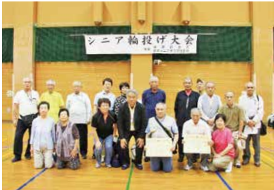
入賞おめでとうございます!

上位入賞はもちろん、とび賞という思わぬ結果に該当クラブは大喜びでした。おめでとうございます。