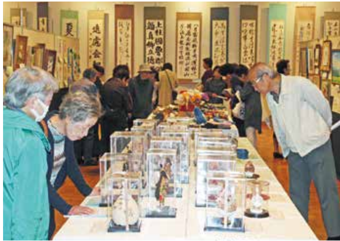
間近で作品を見ていただきました

10月20日(土)・21日(日)、北とぴあ地下展示ホールにてシニア作品展が開催されました。1205名が来場し、70クラブが自慢の作品を出展しました。会場を彩った作品はその総数518点(昨年は64クラブ、543点)。出品者の平均年齢は81歳で、最高齢はなんと97歳。やはり趣味がある人は健康なのかもしれません。当日は喫茶コーナーも併設し、437名の方が利用しました。