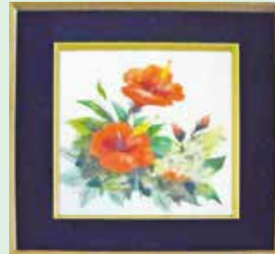
燃えて (ハイビスカス) 西が丘桜クラブ 中田照子