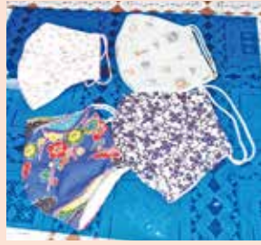
▲手作りマスク ▼ティッシュケース