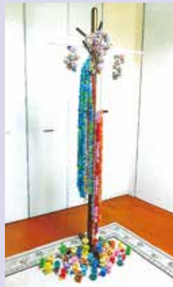
千羽鶴と小人達 西中長寿会 伊藤キミ