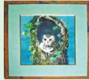
オオコノハズク 鶴ヶ丘楽生会 宮澤信子