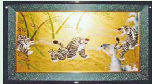
波濤雄壮郡虎図 稲付長生クラブ 齋藤喜美子