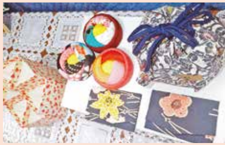
巾着袋・小物入れ▶ 岸一若菜会 高橋道子