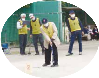
▲一打専念。目指せ優勝

会」が行われました。文京区・荒川区・台東区・北区の各チーム(12チーム)と役員チーム(2チーム)、荒川区女性部委員チーム(1チーム)の計15チームでプレイした結果、北区4チームのうち「伸一延寿クラブ」が見事優勝しました。他の3チームも「王寿会」2位、「ふるさと会」5位、「東十条笑年クラブ」7位と、北区チームは日頃の練習の成果を発揮して大健闘しました。午前中から会場で練習し、午後試合に臨まれた皆様、お疲れさまでした。