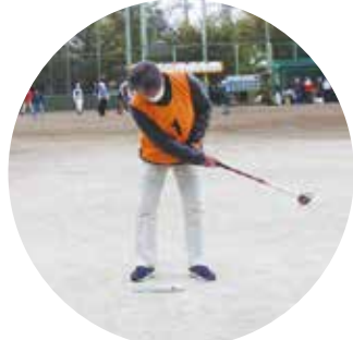
▲最初の一打に心を込める