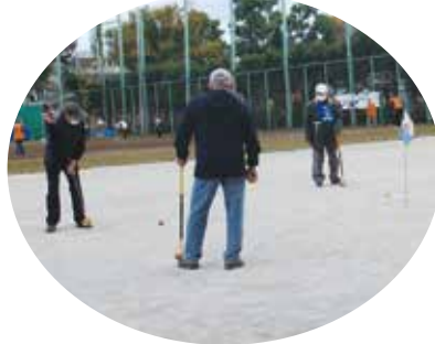
▲入るか否か。視線が離せない