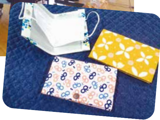
愛情あふれるマスクケース▶