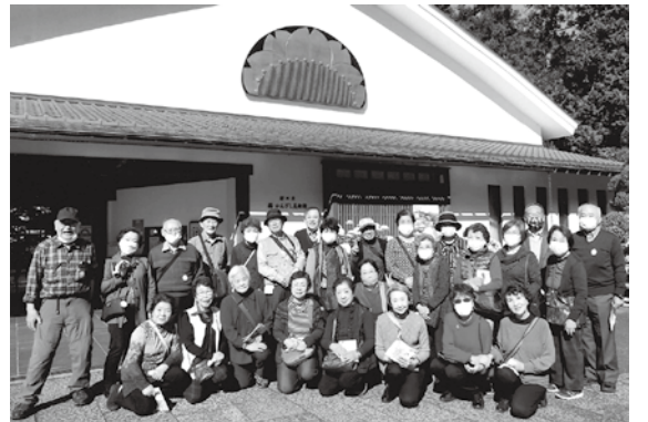
櫛かんざし館前にて

11月13日(金)、コロナ禍で自粛をしていました東部自治会もGOTOトラベルを利用し