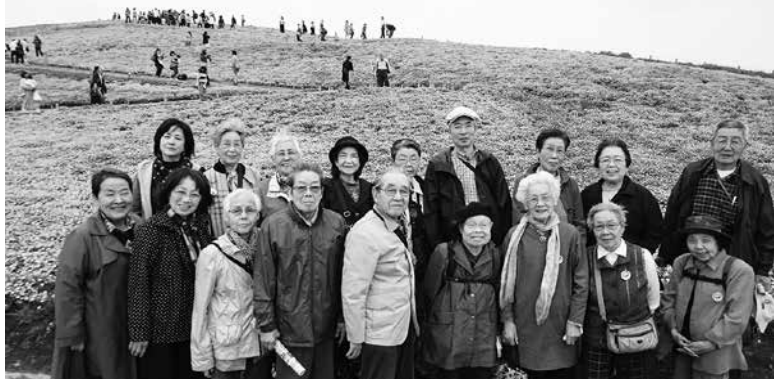
一面の花畑で、皆笑顔

の地域で活動をしています。現在、会員55名の小さなクラブですが、最大の特徴は何と云っても、仲が良いことです。役員10名で、クラブの情報は皆で共有しあい、活動しています。今は何もできない状況で、苦