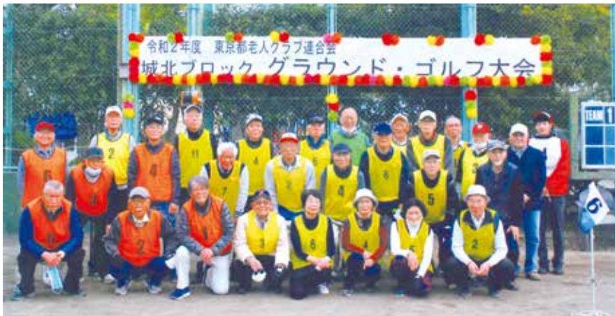
▲大健闘!北区グラウンド・ゴルフチーム

みなさまいかがお過ごしでしょうか? 私たちは北区シニアクラブの活動を応援しています。