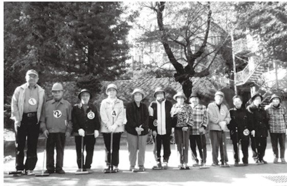
仲良く元気に活動中

このような状況ですが、できるだけ新会員を増やし、それぞれの個性を活かしながら助け合い、楽しく活動する愉快な会を心がけたいと思います。