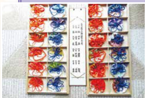
【香入(梅花葉形紐結び)】 東田端みどり会 金子美登里