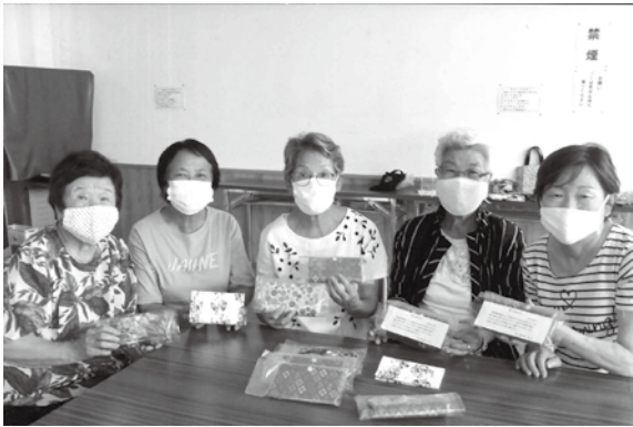
マスクケース作り

赤羽支部で女性部2名が講習 を受け、早速代表6名で色とり どりの布地を使い会員81名のマ スクケースを作りました。ボタ ンをつける所が苦労しました