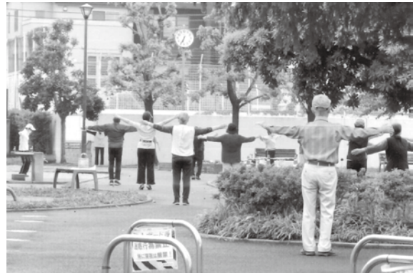
ラジオ体操・北区さくら体操

みなさまいかがお過ごしでしょうか？ 私たちは北区シニアクラブの活動を応援しています