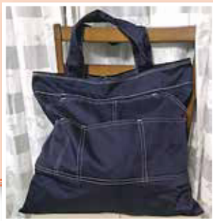
トートバッグ(デニム再利用!) 仲一延寿クラブ 横尾美智子