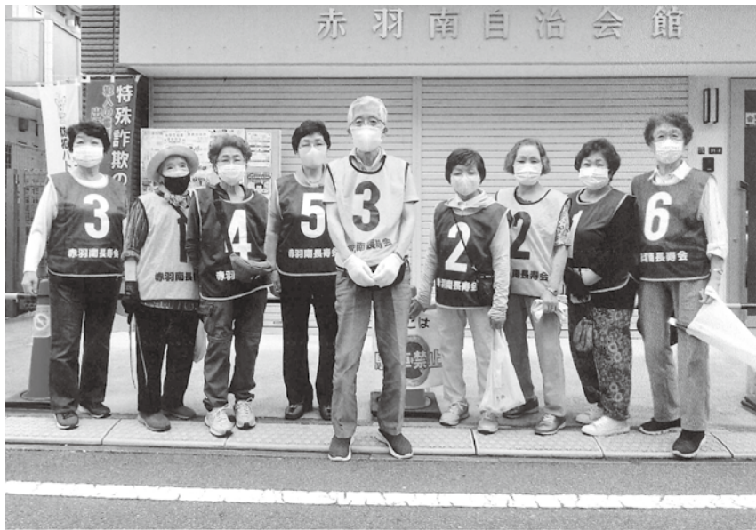
コロナ禍での見守りと奉仕活動

を逃がさないためにも、路上のポイ捨ては止めましょう。一人が捨てた「運」を拾いながら願うことは、新型コロナウイルス感染症が収束し、クラブ活動が通常どおり再開できることです。