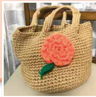
トートバッグ(セーター再利用!) 仲一延寿クラブ 横尾美智子