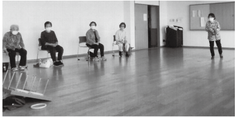
3密回避をしながら楽しむ輪投げ