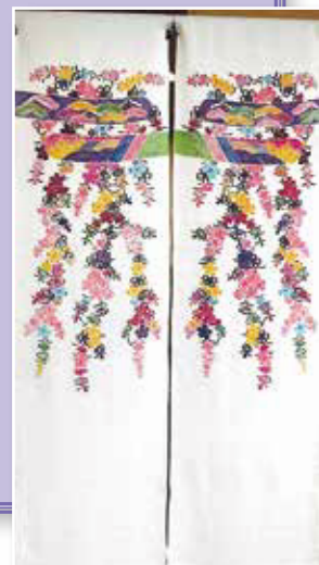
のれん【型染め紅型】 西ヶ原西部鶴寿会 望月ツヨ

みなさまいかがお過ごしでしょうか？ 私たちは北区シニアクラブの活動を応援しています