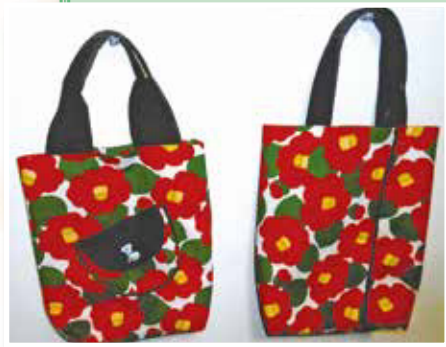
手芸【トートバッグ】 ふるさと会 岡戸貞江