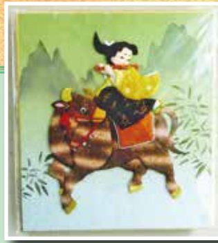
押し絵【木目込】 稲付長生クラブ 斉藤喜美子