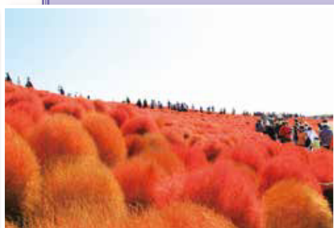
ひたち海浜公園【コキア】 東大原あづま会 植木孝道