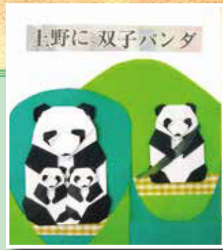
折り紙【双子パンダ】 志茂四長寿会 大池 巖