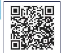
「北区HP(ホームページ)」 二次元コード

システムでの予約が難しい場合 0120-801-222 電話受付時間 平日9:00~17:00