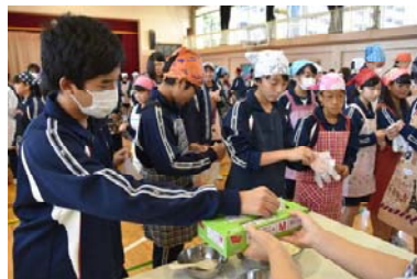
【ビニール手袋配布】