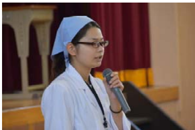
【堀口栄養士から諸注意】