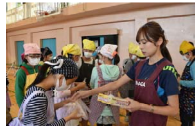
【手袋配布・小学生】