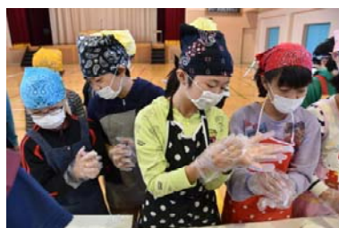
【塩むすび・小学生】