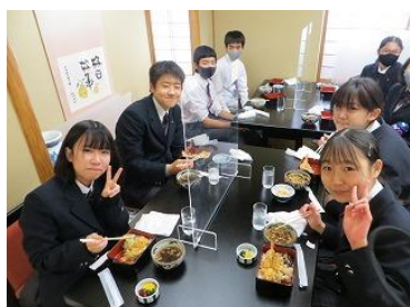
お昼は天丼と 温かいお蕎麦 を頂きました。