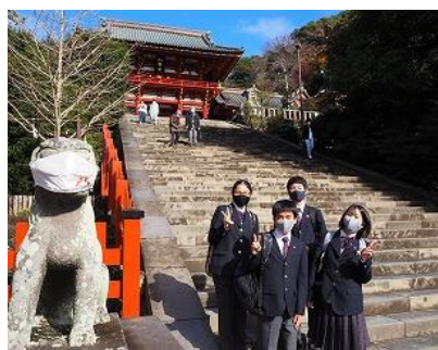
鶴岡八幡宮の 階段下の狛犬もマスク着用！