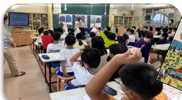
動画がわかりやすく、学びがたくさん！

Peace(平和)のために、自分にできることがある！ と主体的な気持ちが芽生えました♪