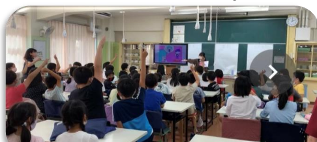
社会課題に立ち向かう高校生に憧れました！

もう1つの出前授業は、「高齢者あんしんセンター」の方々による『認知症サポーター養成講座』です。認知症について正しく「知る」ことで、最適な「支援」や「関わり」ができることを学びました。最後にこんな言葉をかけてもらいました。