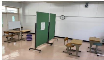
桐ヶ丘郷小学校『さとっこルーム』