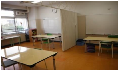
八幡小学校『はちまんルーム』

教室の様子 パーテーションなどで個別のブースを作り、視界に入る物を少なくしたり、音や声などの刺激を軽減したりするなど、集中して課題に取り組める環境作りをしています。