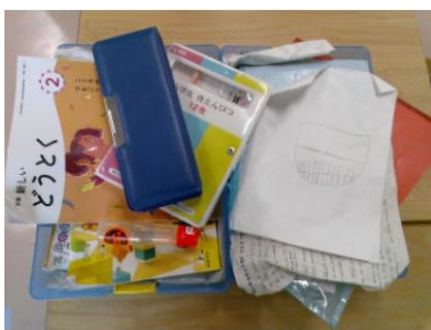
片付ける前の机の中の引き出し