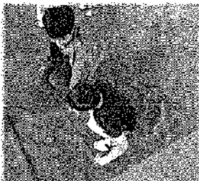
ベーゴマにチャレンジ!