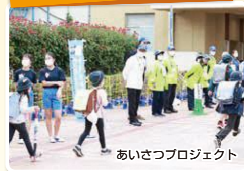
あいさつプロジェクト