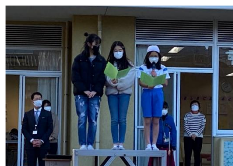
全校朝会にて「ユニセフ活動報告」

なぜ募金が必要なのか、自分たちにできることは何か…。これを機に、なでしこ小の児童一人一人が身近なことから考えて行動していくことが大切だということに気づき、実践して行ってほしいです。