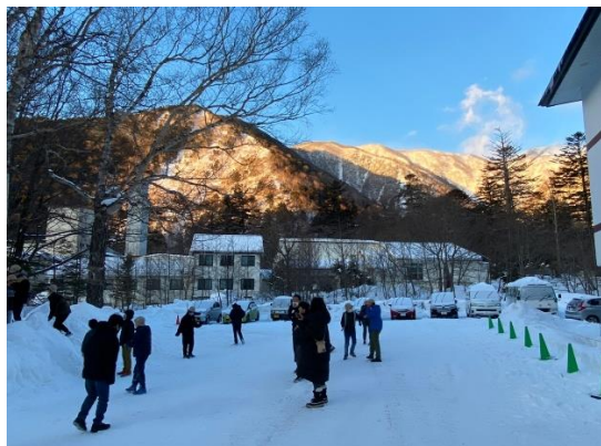
翌朝はマイナス13℃のなか雪遊び！寒いというか「痛い!!!」