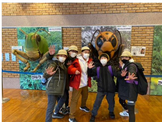
日光には自然がたくさん！ みんなも行ってみてね！