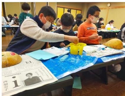
夜はふくべ細工体験！ 上手にできたかな？