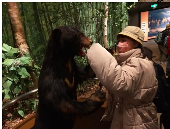
くまと仲良くなれるかも？