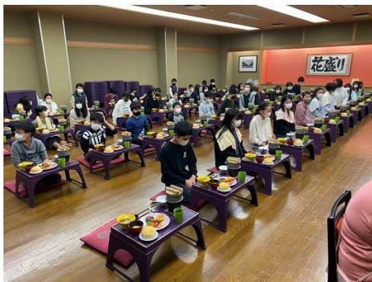
食事はルールを守って…。