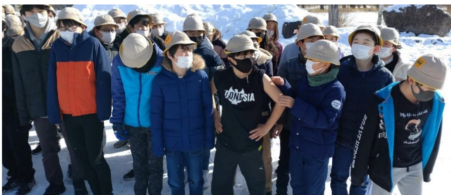
三本松で学年写真撮影。あれ？一人だけ季節が違うような気が…。