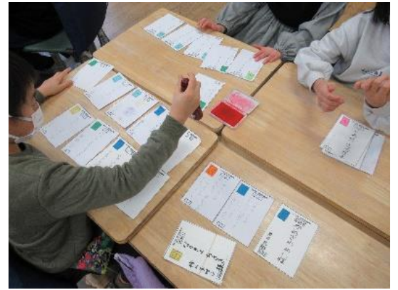
消印を押して、仕分けをしよう。