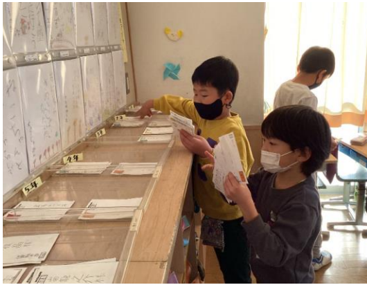
どの位、届いているかな。たくさんあるね。