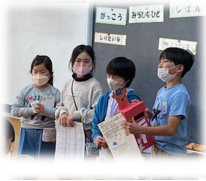
ポスターやポスト、郵便グッズのお届けです。