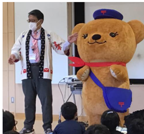
最後には、「ほすくまくん」も登場して子供たちは大喜びでした。