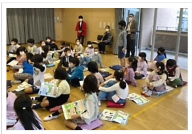
郵便の流れについて詳しく教えていただきました。

今年度も、たくさんの年賀状を届ける活動を通して、郵便の仕事と自分たちの生活との関わりに気付くとともに、西浮間小学校の一員として役に立てたことに喜びを感じることができました。