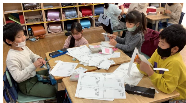
切手は自分たちでデザインして、はがきも作りました。