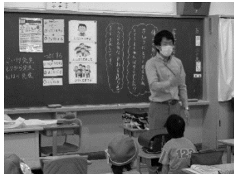
王五小新しい学校生活様式