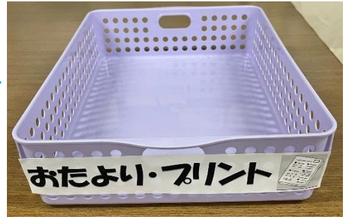
月曜日 もちものチェック表

「なかなか提出物を出してくれない・・・」 手紙やプリントなど提出物を出す場所を決めておくことで、「出さなきゃ！」という意識が高まります。