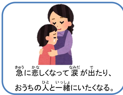
急に悲しくなって涙が出たり、 おうちの人と一緒にいたくなる。