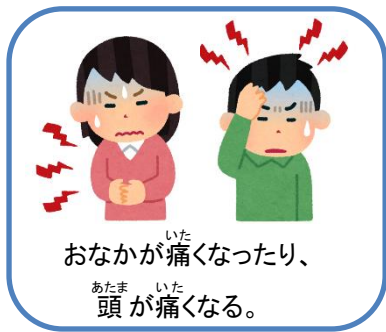
おなかが痛くなったり、 頭が痛くなる。

太陽の光がまぶしく感じられるようになり、暑く感じる日も増えてきました。在校生の皆さんは、昨年度の3月から突然お休みになってびっくりした人もいます。また長い休みの間、テレビやインターネットを見て不安になってしまった人もいるかもしれませんね。人は不安になるとこんな様子が見られます。