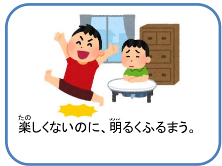
楽しくないのに、明るくふるまう。

思い当たる人がいれば、適度な食事、睡眠をとり、リラックスできる時間を作ってみてくださいね。そして、信頼できる大人にぜひいろいろ話を聞いてもらいましょう。少し気持ちが楽になるかもしれません。