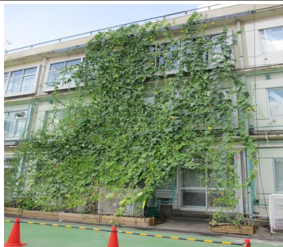
緑のカーテンに、キュウリやゴーヤがたくさん実を付けました

校庭の改修工事は、現在ライン引きを行っています。「すごくきれいだね。」「早く遊びたいね。」という声をたくさん聞きます。完成が楽しみです。