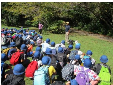
大房岬（オリエンテーリング&磯遊び）