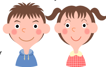
子供たちの声より

1年生のお世話をして、1年生ってかわいいなと思いました。朝に1年生の準備を手伝ってあげたら、とてもよろこんでくれました。20分休みに遊びにいったら覚えていてくれて、腕ずもうをやったり、教室にあった本を読んであげたりしました。やっぱり1年生はかわいいなと思いました。