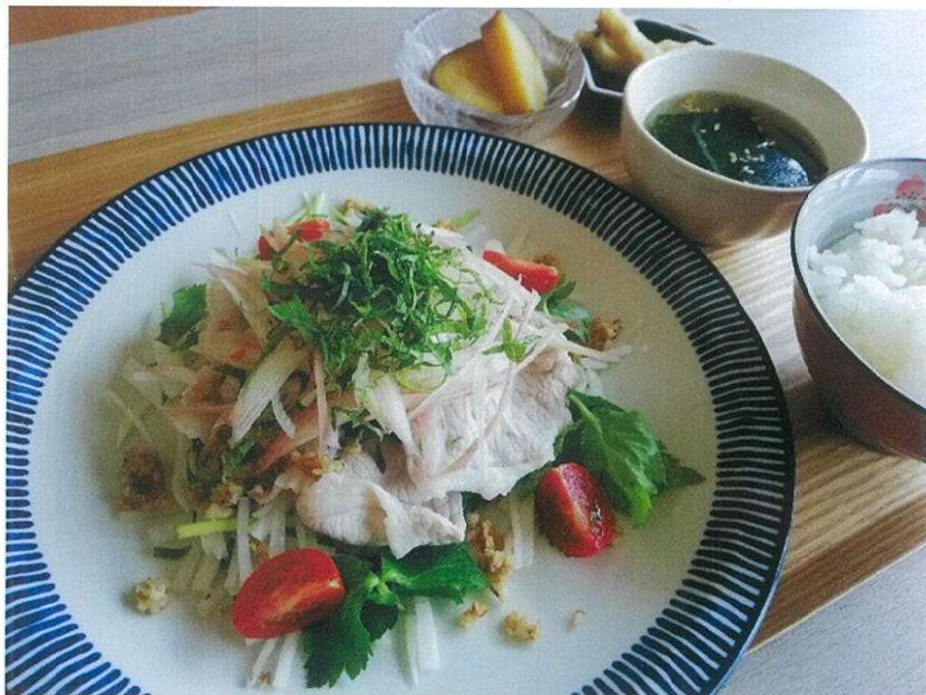
茹で豚の香味野菜サラダ