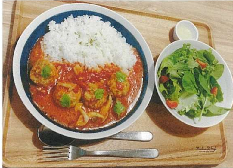
ミートボールの スパイシートマト煮