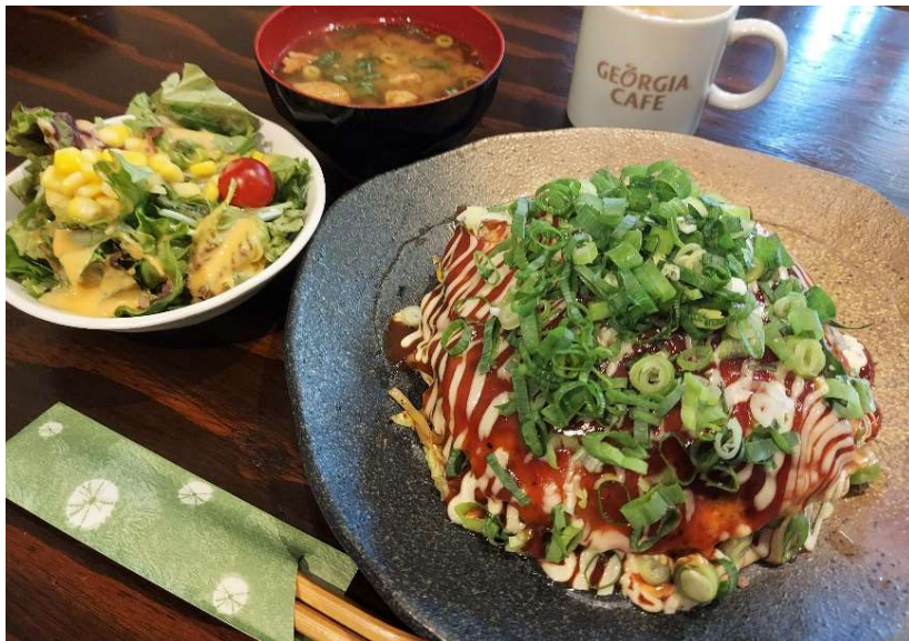
お好み焼き(広島風)ランチ