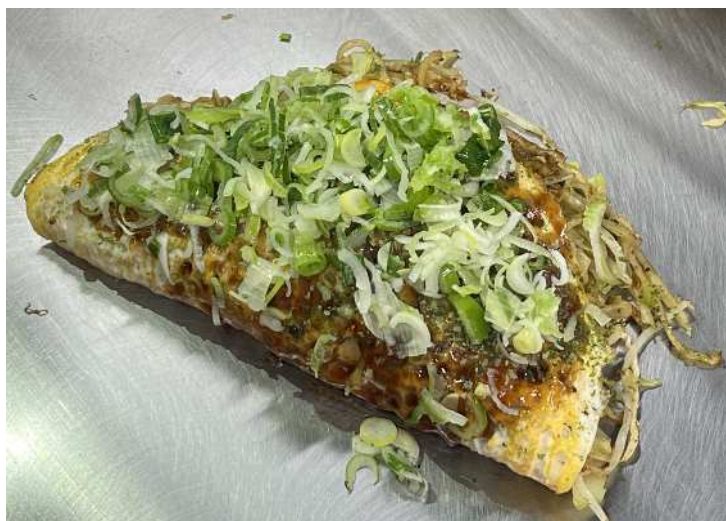
ヘルシー焼きそば (ねぎかけ)